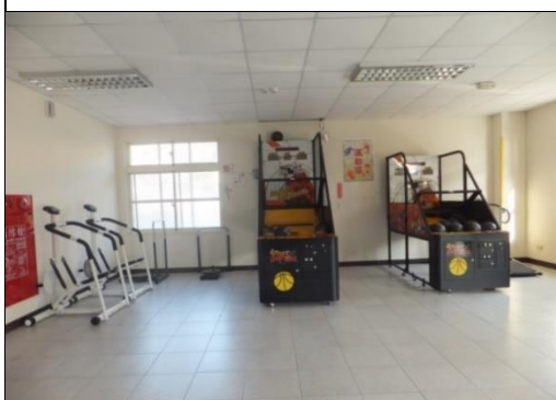
一樓設有籃球機、健身器材