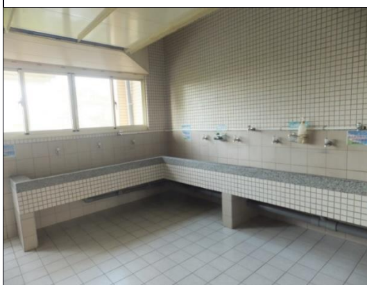
公共區設有洗衣空間和脫水機