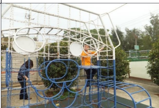
宿舍外有籃球場及遊樂設施