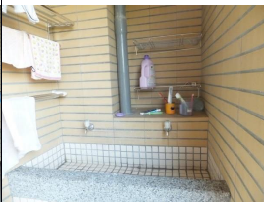
寢室設有洗衣台及曬衣空間