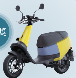
GOGORO VIVA 電動機車x1 (芥末黃)