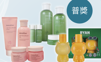
韓國人氣美妝小物x50 (隨機贈送)