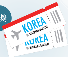
雙人首爾來回機票x1