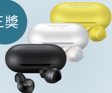
三星真無線藍牙耳機x3 (不挑色)